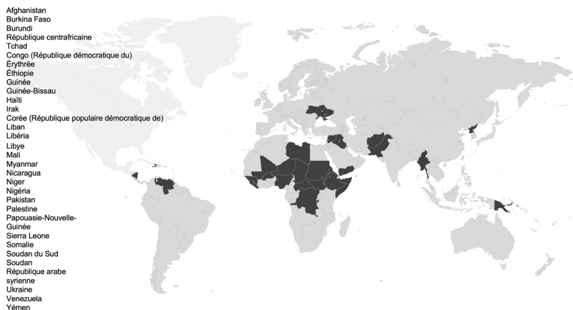
Figure 1. Liste des contextes d'interventions difficiles établie par le Fonds mondial (Fonds mondial, 2025d)

perturbations aggravent la morbidité et la mortalité, entravent la réponse aux épidémies et érodent la confiance des communautés (Blanchet et al., 2017 ; Mercogliano et al., 2025).