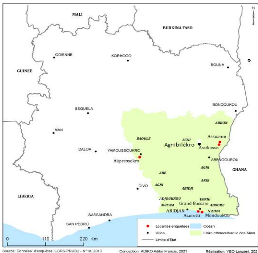
Carte n°1 : Localisation de la zone d'étude