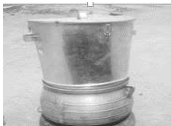
Figure 1 : Dispositif MRT proposé pour le test.

Les efforts ainsi déployés ont permis la conception d'un premier prototype "Kit MRT" dont la cuisson est basée sur la vapeur. Ce prototype contraste avec les procédés traditionnels dans lesquels le riz paddy est plongé dans de l'eau chaude. Il est composé d'une marmite en fonte d'aluminium et d'un bac en forme de seau avec un quart-intérieur perforé de 1 mm de diamètre (voir Figure 1). Aussi, le diagramme technologique d'étuvage du riz paddy est amélioré pour intégrer le kit MRT (voir Figure 2).