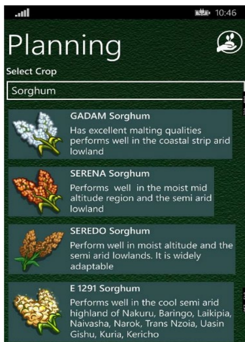
Figure 1. Application développée