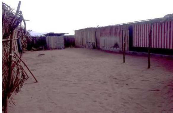
Photo1: Habitat spontané de cour à Anani avec des matériaux de récupération

faites de matériaux de récupération de planches de bois, de toile, de bâches usées, de sac plastique (Photo 1).