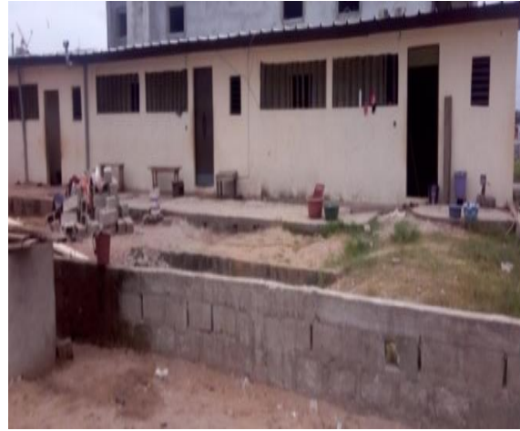
Photo 3 : Habitat en bande individualisée dans le quartier Anani-Amamou, Cliché : Dally, 2021