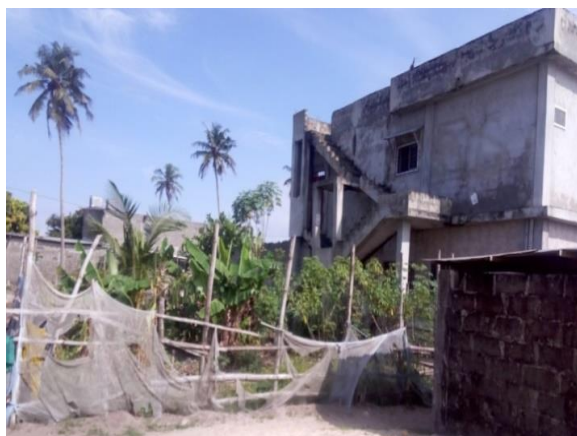
Photo 1: Cette construction supplante les autres habitations, Cliché, Dally, 2019