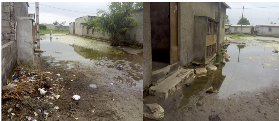
Planche 3 : Un habitat sous les eaux

En effet, le positionnement géographique de Gonzague-Anani donne un relief de plaine, sur un sol sableux. Aussi son aspect non bitumé et difficilement praticable en saison de pluie, lui a valu l'appellation de Terre Rouge. Cette situation est un obstacle à la circulation des biens et des personnes. Ce périurbain est caractérisé par une absence d'un réseau de canalisation. La trame urbaine constituée par les lotissements informels laisse des tracées qui servent de voie de circulation. Ces voies servent par la même occasion de réseau d'évacuation des eaux usées. Ce sont 64,26% des ménages qui rejettent les eaux usées dans la rue contre 35,74% qui utilisent les égouts ou les fosses septiques. Ce mode d'évacuation peu commode participe à désorganiser l'espace, dégradant ainsi l'habitat et le cadre de vie de la population (Planche 2).