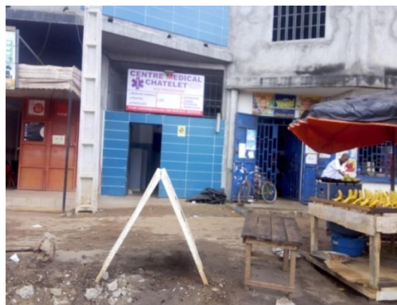
Photo 5: Empilement des activités et des habitations sur un même espace, Cliché, Dally, 2019