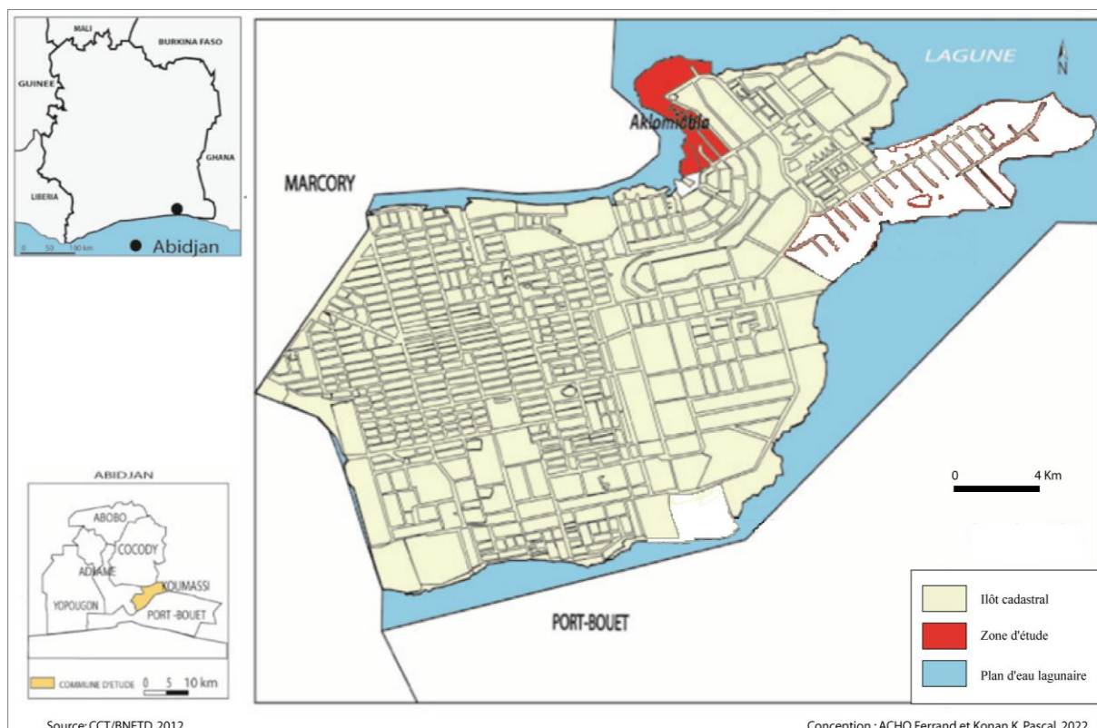
Figure 1 : Localisation du quartier Aklomiabla

Par ailleurs, l'observation directe a permis, à travers plusieurs visites sur le site d'étude, d'appréhender le paysage du quartier et de recueillir des données sur la nature des matériaux de construction des logements et la typologie de l'habitat. Aussi, le fond cartographique utilisé est un fichier numérique du parcellaire du quartier Aklomiabla fourni par le cadastre et actualisé à l'aide de l'application cartographique Google Earth. Il a permis de réaliser la carte de localisation du site d'étude (Figure 1).