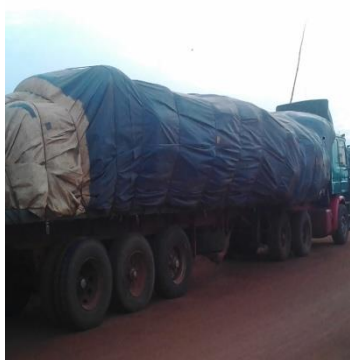
Photo 2 : Sacs de riz chargés depuis le port de Cotonou pour les magasins de Illara

A Illara Kanga, plusieurs magasins servent de site de stockage des produits exportés vers le Nigéria notamment le riz (comme l'indiquent les photos 2, 3 et 4).