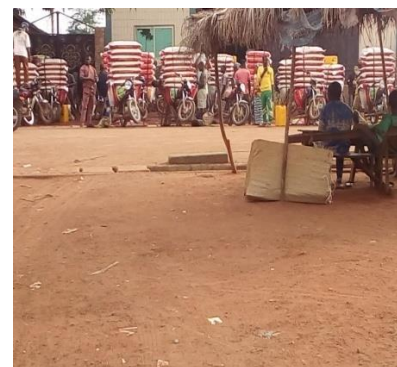
Photo 4 : Sacs de riz chargés sur des motos zémidjan spécialisées dans

Cliché : Azalou Tingbé E., août 2017 Les taxi-motos (photo4) chargent des sacs de riz (8 à 10 sacs/r et aussi des personnes (3 à 4 personnes/moto). Le transport est également assuré par les camions gros porteurs pour les marchandises, les voitures personnelles transportant de l'huile et aussi des voyageurs. Certaines entreprises sont officiellement enregistrées contrairement à d'autres qui optent ainsi pour l'informel.