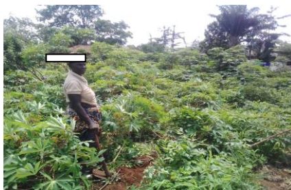
Photo1 : étendue de champs Cliché : Azalou Tingbé E., août 2017

Les cultures de rente observées sont le maïs et l’acajou. A cela s’ajoutent les cultures vivrières comme le gombo, la tomate, le manioc, l’arachide, le sésame, etc. Illara regorge de potentiels producteurs des produits vivrier comme : la tomate, le piment, le maïs, le soja, le manioc, l’arachide, les noix de palme, la patate douce etc. Parmi ceux-ci, le manioc et le maïs sont les plus produits, comme l’indique le graphique 1.