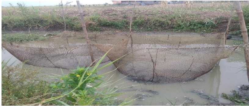
Photo 1 : Dispositif des happas dans le village d'Agonli-lowé

être installés dans les trous à poissons. Les happas ne sont rien d'autres que des poches de filets de forme carré ou rectangulaire, maintenues à chaque extrémité par un dispositif de piquets en bois, souvent des bambous (Figure 1). Un tel investissement n'est pas à la portée des agro-pisciculteurs qui ont alors sollicité et obtenu l'aide d'AquaDeD. Ainsi, des dossiers d'appuis techniques et financiers sont élaborés et exécutés avec les agro-pisciculteurs.