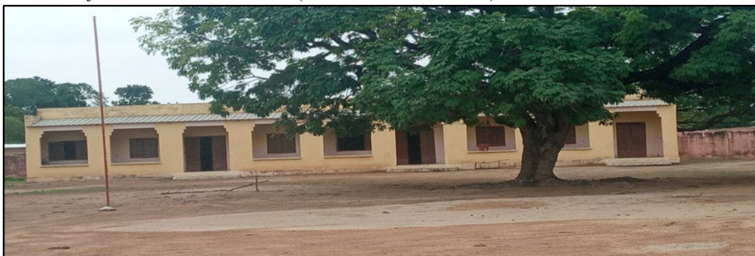
Photo 3 : école fondamentale construite par la mine d'or de Morila dans le village de Morila

« la mine a construit un jardin d'enfants et recruté 10 enseignants . Ces enseignants sont payés par la mine. La mine fait la préparation du DEF (Diplôme d'Études Fondamentales) blanc. Elle participe également à la réhabilitation des salles de classe et la dotation de certaines écoles en fournitures scolaires » (09 Mai 2023 à Sanso).