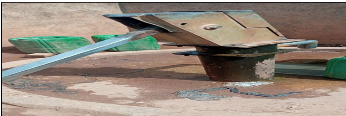
Photo 2 : pompe d'eau réalisée par la mine d'or de Morila dans le village de Sanso